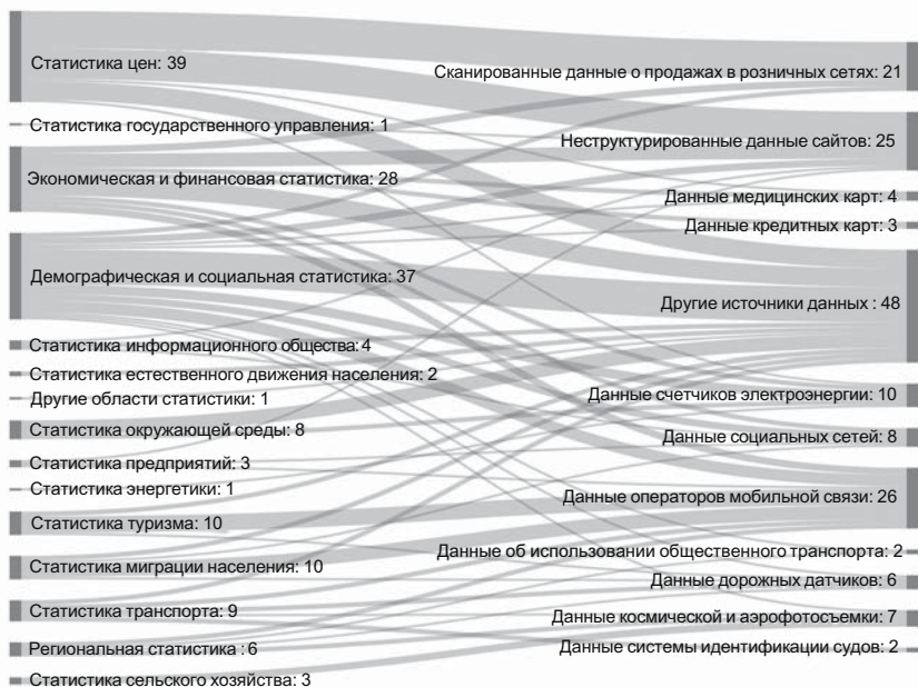
Рис. 2. Использование альтернативных источников данных в различных областях статистики: международный опыт (число проектов, реализуемых национальными статистическими службами и международными организациями с привлечением больших данных)