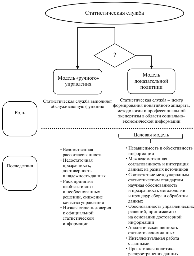
Рис. 1. Модели статистической службы